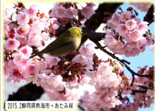
2015. 2静岡県熱海市・あたま桜