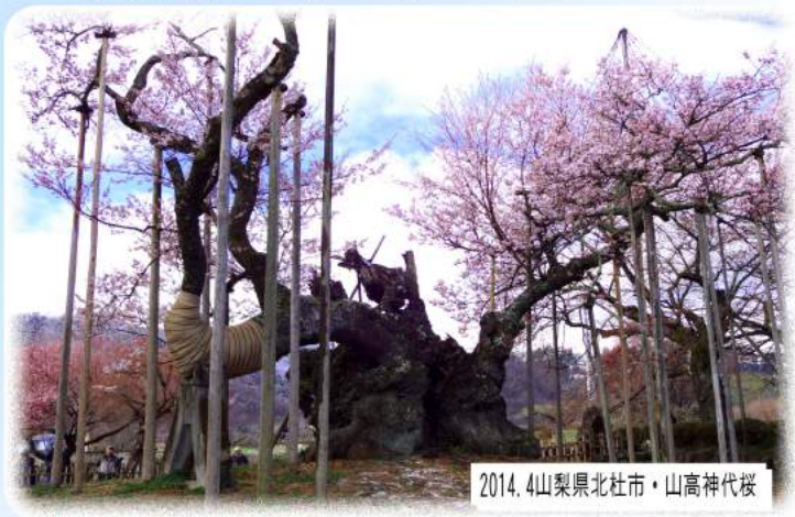
2014. 4山梨県北杜市・山高神代桜

「山高神代桜」日本三大桜のひとつで、樹齢約二〇〇〇年で日本最古と云われています。主幹を台風で失いましたが、毎年、支柱に見事な花を咲かせて人々を魅了しています。まだまだ生命力は健在で、地元では、往年の風格を甦らせようと試みています。 「あたま桜」梅と共に寒桜が、ひと足早い春の訪れを感じさせます。早咲きで有名な河津桜より、ひと月ほど開花が早く開花期間も一ヶ月程と長く楽しめるようです。 (広報準備室)